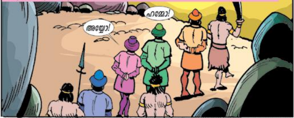
കപ്പലിലുണ്ടായിരുന്നവരെയെല്ലാം പിടികൂടി ചങ്ങലകളിൽ നരഭോജികൾ ഗോത്രത്തലവന്റെ അടുത്തേക്കു നടന്നു.