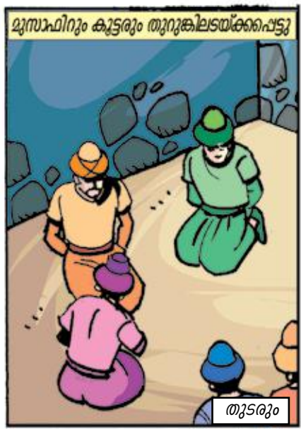
മുസാഫിറും കൂട്ടരും തുറുകിലടയ്ക്കപ്പെട്ടു