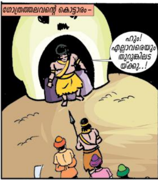
ഗോത്രത്തലവന്റെ കൊട്ടാരം -