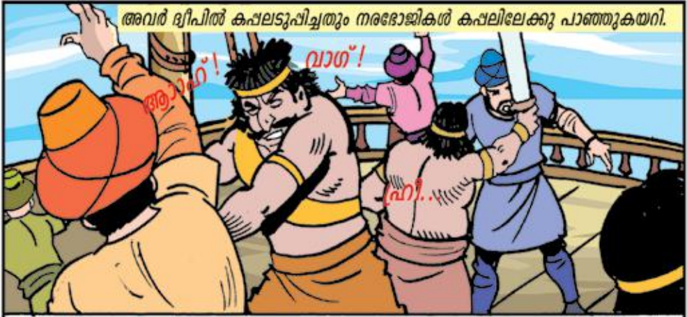
അവർ ദ്വീപിൽ കപ്പലടുപ്പിച്ചതും നരഭോജികൾ കപ്പലിലേക്കു പാഞ്ഞുകയറി.