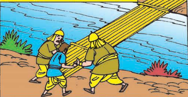
മച്ചാൻമാർക്ക് ഇത്, കുൾ സീനാണ്