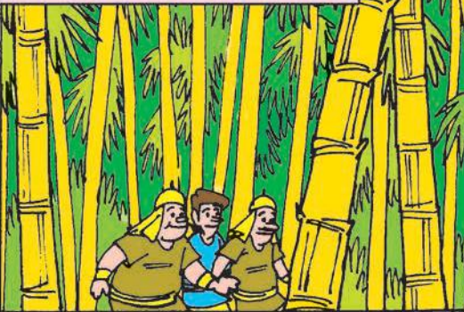
കുറെ മുള കൊണ്ടു വരുന്നു