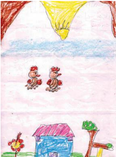
അശാലിന തോപ്പിൽ യു.കെ.ജി - ഇ പീസ് പബ്ലിക് സ്കൂൾ മതിലകം

നിദ ഹിദായ. കെ ക്ലാസ് 9 ഐ.എസ്.എസ് എച്ച്.എസ്.എസ്, പൊന്നാനി