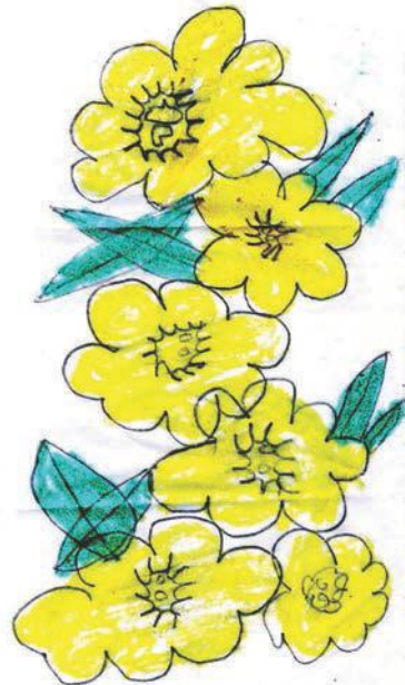
ദ്വൽഫിക്കർ ദാനുസ്സലാം എൽ.പി സ്കൂൾ ചാലക്കൽ ആലുവ